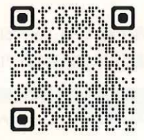
▲参加申し込みフォーム▲